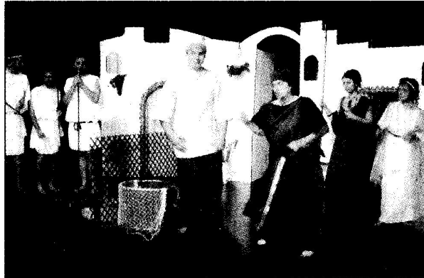
A Nice, la Comédie des Remparts a reçu un franc succès.